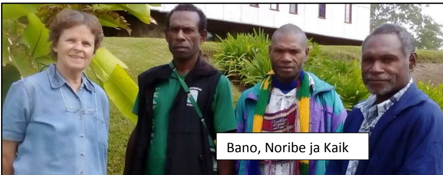
Bano, Noribe ja Kaik

Papua-Uudessa-Guineassa Wycliffe Raamatunkääntäjien työyhteydessä vuodesta 1984, nekin kielen parissa vuodesta 1988.