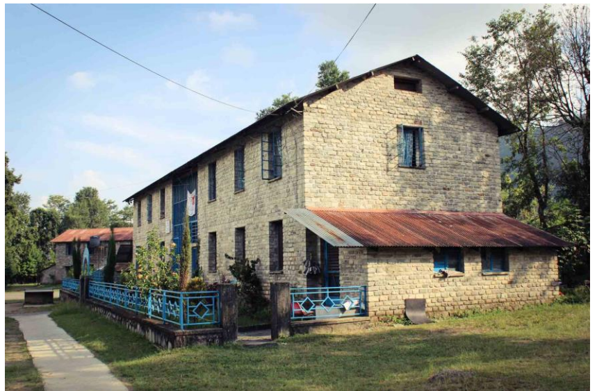
Gandakin kampusalue on hiljentynyt, kun kaikki oppilaat ovat palanneet koteihinsa.

Kevät on ollut koronapandemian takia poikkeuksellista aikaa. Olemme tilanteessa, jossa meillä on paljon kysymyksiä, mutta hyvin vähän varmoja vastauksia. Erityisesti tilanteen tekee ennen kaikkea se, että tämä koskettaa kaikkia ihmisiä ympäri maailmaa, myös Nepalia. 24.3., kun maassa oli vahvistettu vasta kaksi koronatapausta, hallitus määräsi maahan "lock-downin"; ihmiset määrättiin pysyttelemään kodeissaan, vain välttämättömillä ruoka- tai lääkeostoksilla on ollut lupa käydä. Koulut oli suljettu jo edellisellä viikolla – juuri, kun peruskoulun päättävän 10. luokan valtakunnallisten