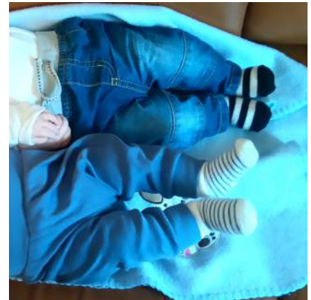
Tänä kesänä tuli ihmeteltyä tädin roolissa pienoä varpaita.

Kesä meni valtavan nopeasti ja elokuun lopussa laukkuja pakkaillessa mietin, että mihin se kolme kuukautta oikein katosi. Kotimaankausi piti sisällään paljon reissaamista, iloisia kohtaamisia nimikkoseurakunnissa, rippileirivierailuja, evankeliumijuhlat, lauluiltoja, perhejuhlia, keuhkokuumeen, sukulointia, ystävien tapaamista, marjastusta sekä sisarusteni samanikäisten vauvojen suukottelua. Kaikenkaikkiaan siis vaihteleva ja virkistävä kesä!